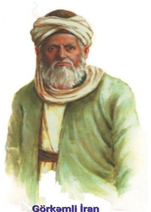
Görkəmli İran Alimi Şeyx Bəhai

İran İslam Respublikasının Naxçıvandakı Baş Konsulluğunun Mədəniyyət Attaşelyi